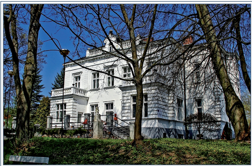
Dwór Lutosławskich w Drozdowie, obecne Muzeum Przyrody