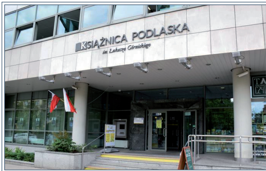
Książnica Podlaska im. Łukasza Górnickiego w Białymstoku